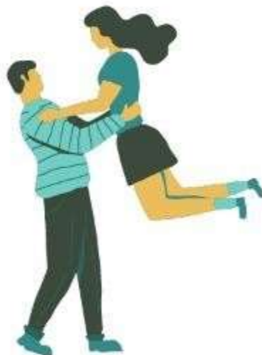
Relaciones (Pv 18:24)