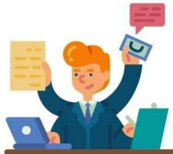
Muchas actividades (Ec 5:3)

Cuando tratamos de huir de la presencia de Dios, nos inquietamos. Solo junto a Él los seres humanos tienen paz y descanso.