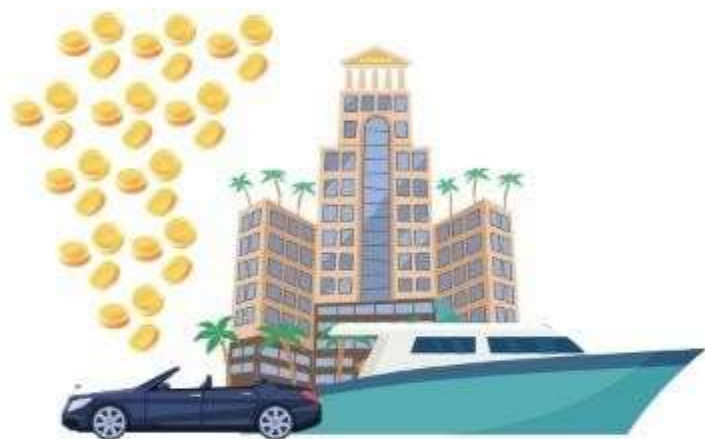
Bienes materiales (Ec 5:10)

Por sus actos pecaminosos y su desobediencia, Caín se convirtió en «errante y extranjero en la tierra» (Gn 4:12). Y hoy, la gente trata de llenar el anhelo de la gracia divina con: