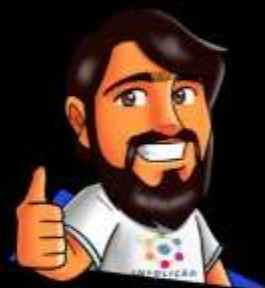
Diseño: Pablo Amon