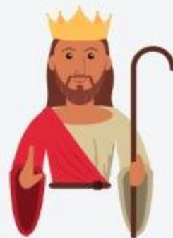
Raíz de David