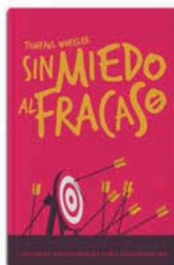
LD adolescentes 2021 [11831]