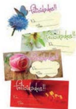
Autoadhesivos: Motivos varios [9035]