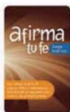
Afirma tu fe JB cartas [5691]