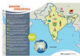
Mapa misionero - 4° trim. 2020 [11201]