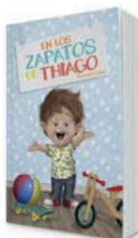
En los zapatos de Thiago [11132]