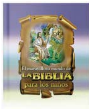
El maravilloso mundo de la Biblia para los niños [298]