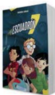
Escuadrón 7 [11138]