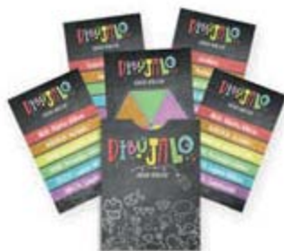
Dibújalo JB cartas [11396]