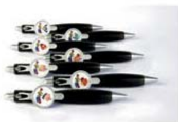
Biromes Mis Amigos [9020]