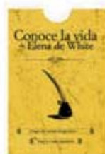
Conoce la vida de Elena de White JB cartas [6161]