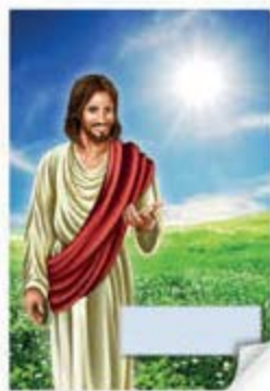
Cartel puerta - habitación/aula [7822]