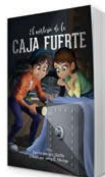
El misterio de la caja fuerte [11135]