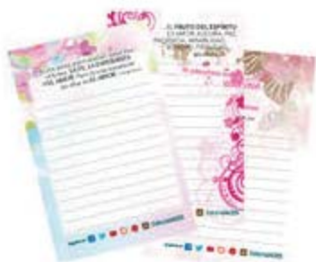
Block pequeño con versículos Motivos varios [9353]