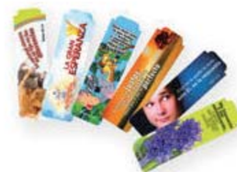
Señalador imán [7600]