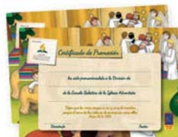
Certificado de promoción [9549]