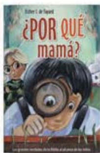
¿Por qué, mamá? - 2ª ed. [6458]