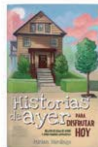
Historias de ayer para disfrutar hoy [9931]