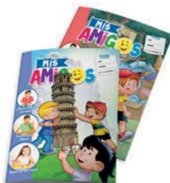
Revista Mis amigos