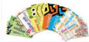
Tarjetas visitas genéricas x 10 [8677]