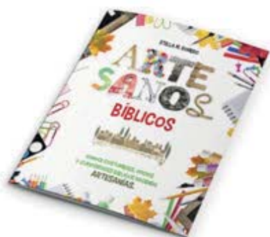
Artesanos bíblicos [10829]