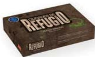
Ciudades de refugio JB [10646]