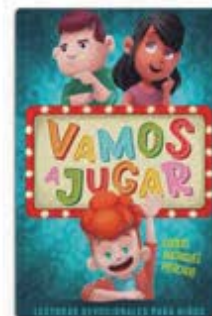
LD niños 2021 [11830]