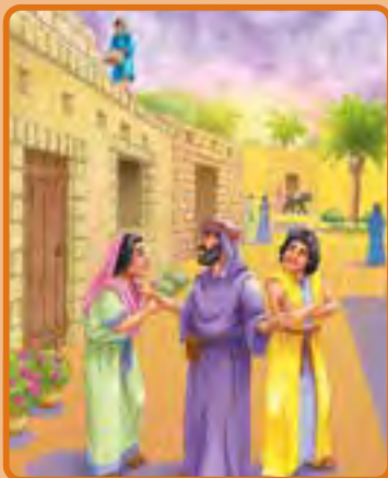
2 Reyes 4:8-37