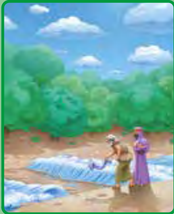
2 Reyes 2:1-18