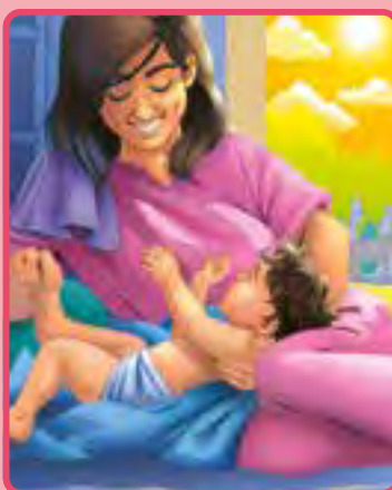
1 Samuel 1:20-28; 2:18-21