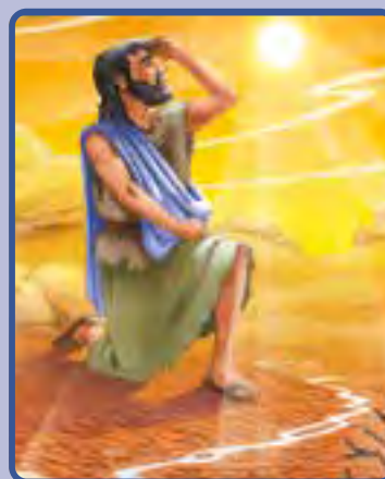
1 Reyes 17:7-16