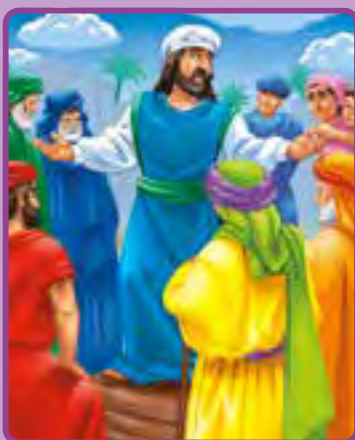
1 Samuel 7