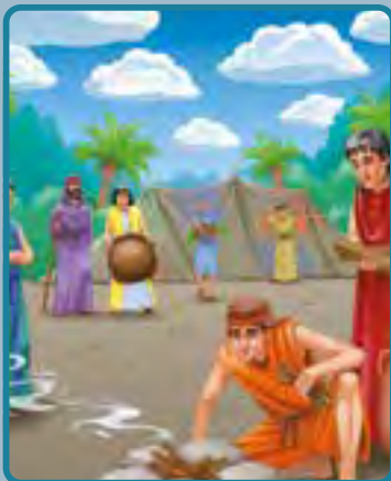
2 Reyes 4:38-41