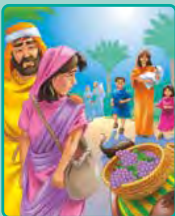
1 Samuel 1:1-18

Cada semana, recorta la figurita que corresponde a la lección y, con la ayuda de tus padres, pégala en el lugar de tu Biblia donde se halla escrita la historia. Luego, trata de buscarla y de recordar dónde está la historia que has aprendido esa semana.