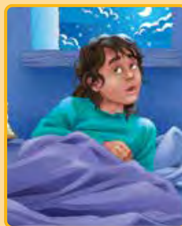
1 Samuel 3:1-10