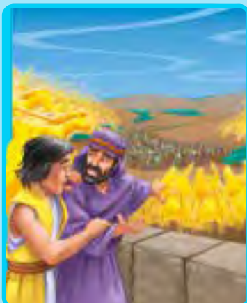
2 Reyes 6:8-17