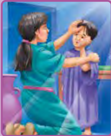
1 Reyes 17:17-24