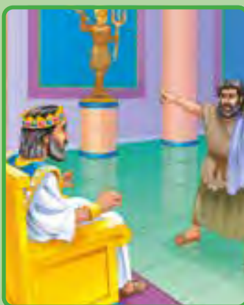
1 Reyes 17:1-6