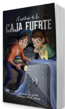
El misterio de la caja fuerte [11135]