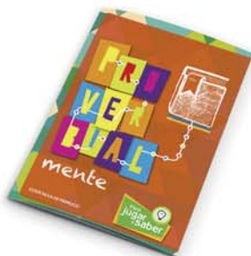
Serie "Mente": ProverbialMente- 2ª ed. [8834]