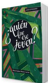
¿Quién fue ese joven? [9 009]