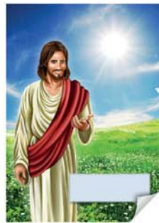
Cartel puerta - habitación/aula [7822]