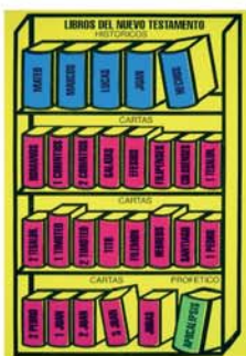
Armador libros del Nuevo Testamento Juego bíblico goma eva [928]