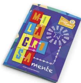
Serie "Mente": MilagrosaMente- 2ª ed. [8835]