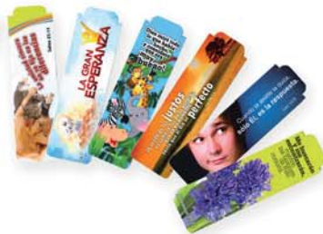
Señalador imán: Estándar [7600]