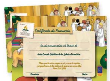
Certificado de promoción - 3a ed. [9549]