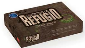
JB Ciudades de refugio Juego bíblico [10646]