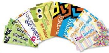
Tarjetas visitas genéricas x 10 [8677]