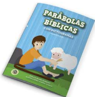
Parábolas bíblicas con pictogramas [9340]