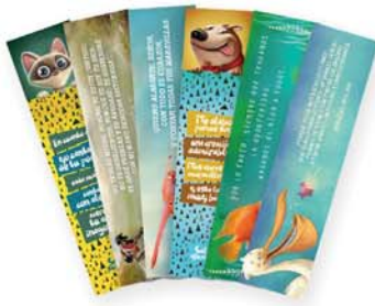
Señaladores varios ACES - 2016 [10031]