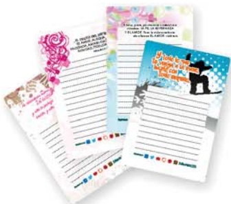
Bloc pequeño con versículos: Motivos varios [9353]