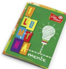
Serie "Mente": IluminaMente- 2ª ed. [8833]