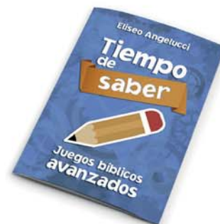
Tiempo de saber [8859]