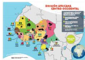
Mapa misionero - 3er. trim. 2020 [11200]