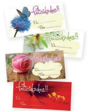
Autoadhesivos: Motivos varios [9035]