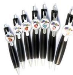
Biromes: Mis Amigos [9020]