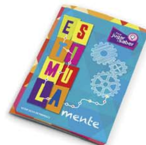
Serie "Mente": EstimulaMente - 2ª ed. [8832]