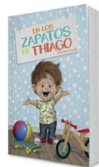
En los zapatos de Thiago [11132]