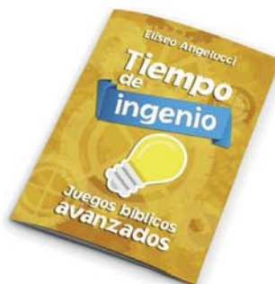
Tiempo de ingenio [8858]