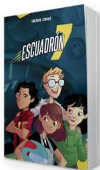
Escuadrón 7 [11138]