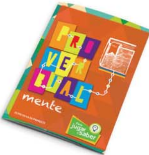
Serie "Mente": ProverbialMente - 2a ed. [8834]