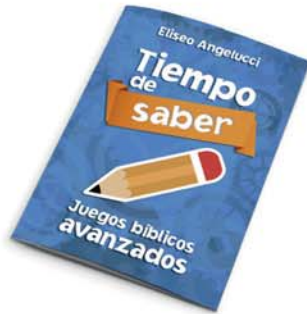
Tiempo de saber - 2a ed. [8859]