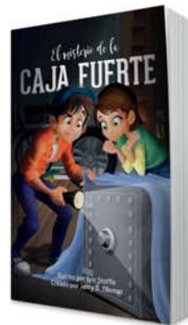
El misterio de la caja fuerte [11135]