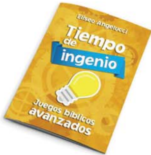
Tiempo de ingenio - 2a ed. [8858]