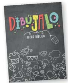
JB cartas: Dibújalo - 1a ed. ACES [11396]