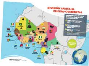
Mapa misionero - 3er Trim. 2020 [11200]