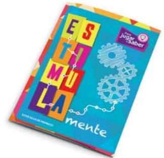
Serie "Mente": EstimulaMente - 2a ed. [8832]