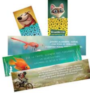
Señaladores varios ACES [10031]