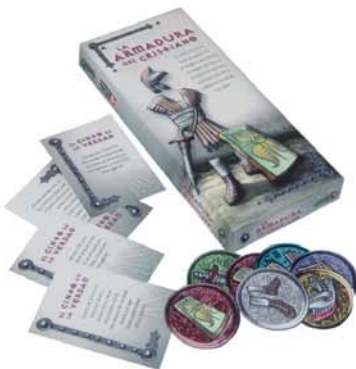
JB La armadura del cristiano [4148]