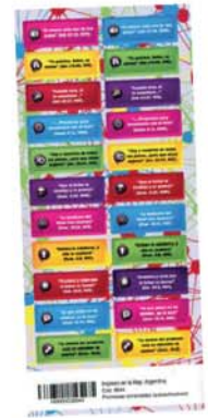
Autoadhesivos: Promesas conectadas - 2a ed. [8944]