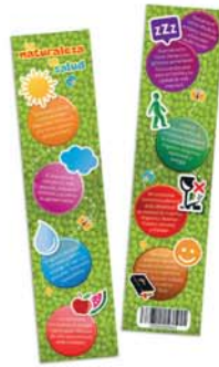
Señalador remedios Naturales [8643]