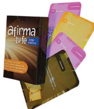
JB cartas: Afirma tu fe [5691]