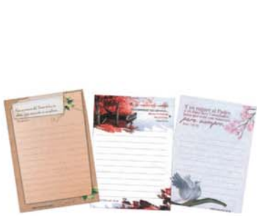
Block pequeño con versículos - Motivos varios [9353]