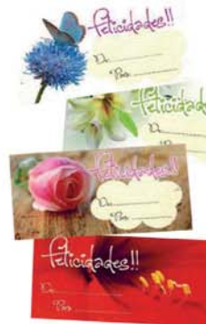
Autoadhesivos: Motivos varios [9035]