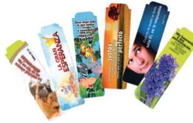
Señalador imán: Estándar [7600]