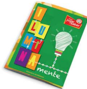
Serie "Mente": IluminaMente - 2a ed. [8833]