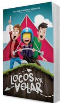
Locos por volar [11144]