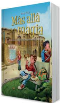
Más allá de la magia [11141]