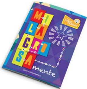
Serie "Mente": MilagrosaMente - 2a ed. [8835]