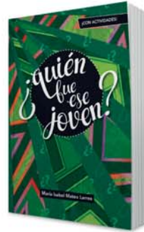
¿Quién fue ese joven? [9009]