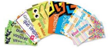
Tarjetas visitas genéricas x 10 [8677]