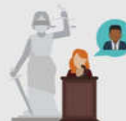
QUERELLANTE (Daniel 8:13a)