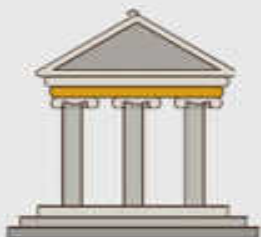
TRIBUNAL (Daniel 7:10b)