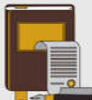
REGISTROS (Daniel 7:10d)