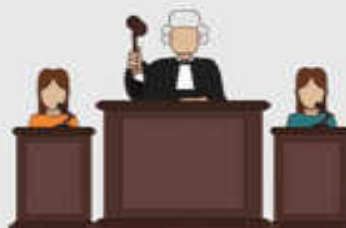
JUICIO (Daniel 7:10c)