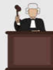
VEREDICTO (Daniel 8:14)