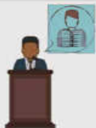
TESTIGOS (Daniel 7:10a)