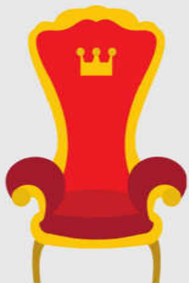
TRONOS (Daniel 7:9)

Daniel 7 y 8 tratan del mismo evento; una escena de juicio. Hay elementos clave en ambos capítulos: