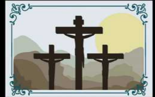
La cruz (1Pe 1:18-20)

Sería una fábula si el pecado no causase la muerte.