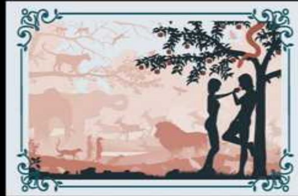
La caída (Gn 2:17 e 3:6)

Se volvería un mito si se acepta la evolución.