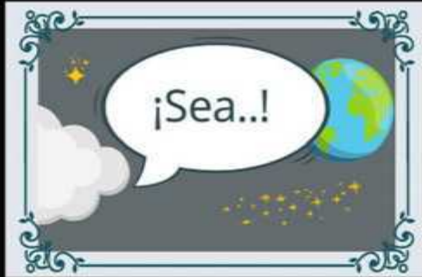
La creación (Gn 1:1, 31)

La Biblia presenta un vínculo ininterrumpido entre la creación perfecta, la caída, el Mesías prometido y la redención final.