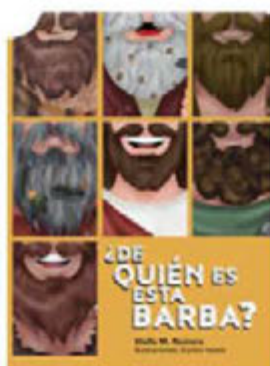
¿De quién es esta barba? [9526]