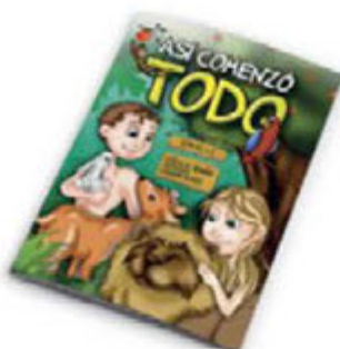
Así comenzó todo [8360]