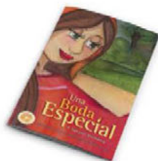
Una boda especial - A special wedding [6564]