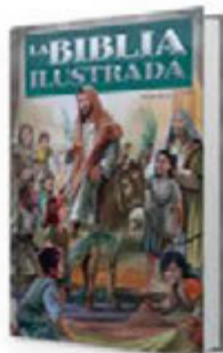
Biblia ilustrada RVR 95 - Con guía práctica para niños [9690]