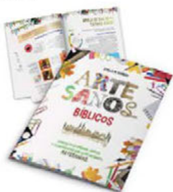
Artesanos bíblicos [10829]