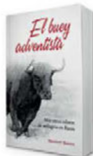
El buey adventista [8139]

Pídalos a su coordinador de Publicaciones.