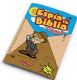
Espía tu Biblia [6544]