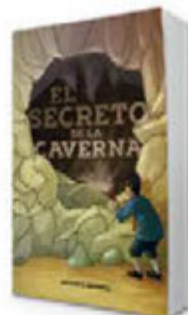
El secreto de la caverna - 3ed. [9928]