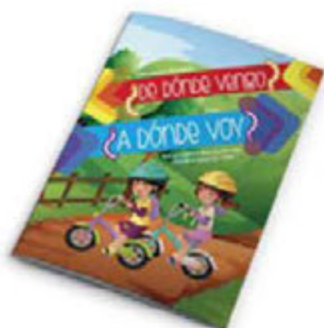
¿De dónde vengo? ¿A dónde voy? [8794]