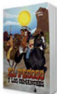
El pecoso y los comanches - 2ed. [8808]