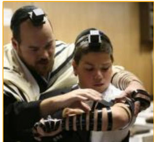
Tefillin, Deut. 6: 8

4 Es la falsificación del sello de Dios, es decir, del cuarto mandamiento que santifica el sábado Apocalipsis 13:16-18