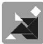
Estudio de la Biblia