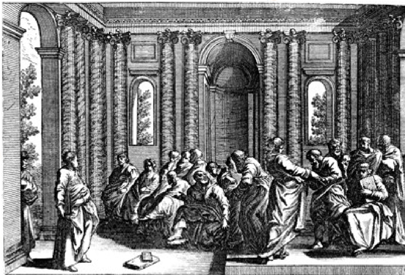
Judíos helenistas versus gentiles incircuncisos

La palabra de Hechos 15:2 ( stasis ) tiene el sentido de “conflicto” o “disensión”.