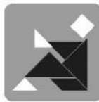
Estudio de la Biblia