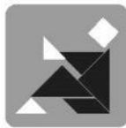
Estudio de la Biblia